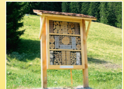
Refugi d'insects / Insektenrefugium