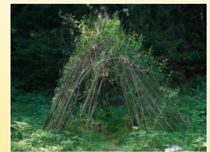
Construcziun da salisch / Weidenbau