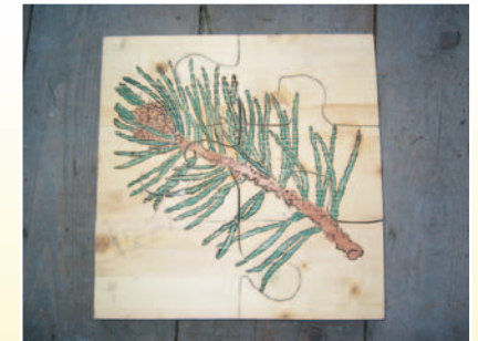
Cumbinialas / Puzzles