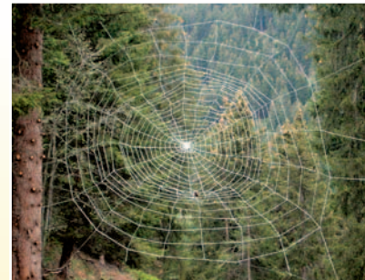
Teila falien / Spinnennetz