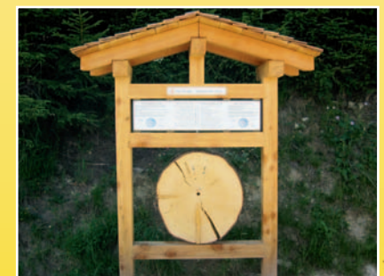
Diari d'in pégn / Tagebuch einer Tanne