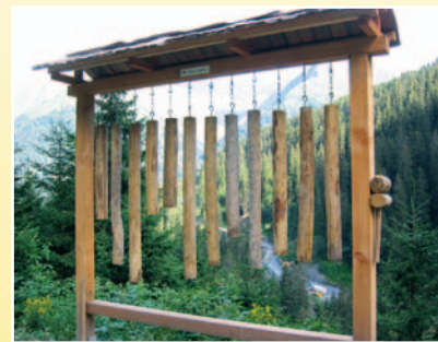
Xilofon / Xylofon