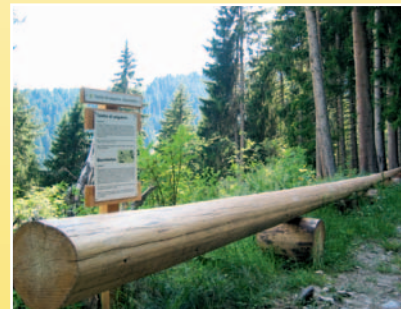
Telefon dil petgalenn / Baumtelefon