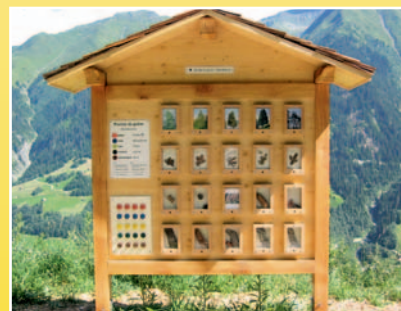
Plontas da guilas / Nadelbäume